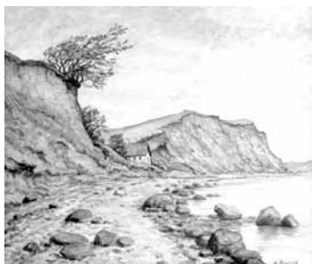
maleri af Heinrich Blunch

Hvor stien igen fører ned på stranden, kan man se rester af et hus, der er skyllet i havet. Gamle optegnelser viser, at der siden 1876 er skyllet omkring 5 ha jord i havet af den ejendom, hvor sporet går.